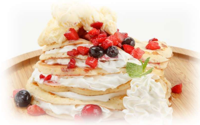
写真はバニラアイス(¥150)+ベリーミックス(¥100)、合計¥950のイメージです